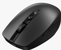
HP 710 Rechargeable Silent Mouse 6E6F2AA