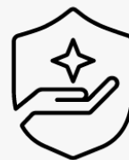
3 års henting og retur UM963E