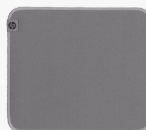
HP 100 desinfiserbar musematte 8X594AA