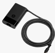
HP USB-C 65W Laptop Charger 671R2AA