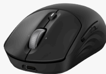
HP 700 oppladbar trådløs mus AZ7B0AA